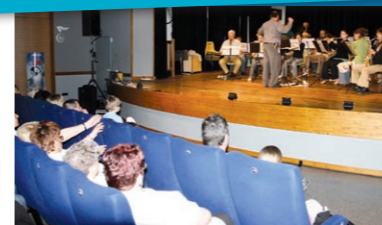
SÉANCE DE VARIÉTÉS « Tous acteurs, proches et solidaires »