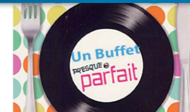
ANIMATION « Pause gourmande »