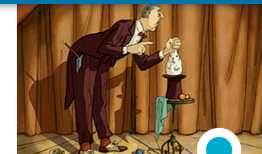
CINEMA « L'illusionniste »